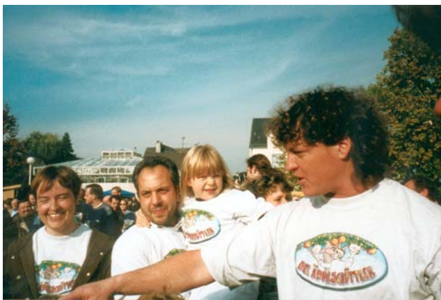
Die Gewinner des Jahres 2000

Das Geheimnis jedoch, wer diesjähriger „Kronberjer Äppelweimaaster“ ist, wird erst anlässlich des Apfelmarktes am 29.09. gelüftet werden.