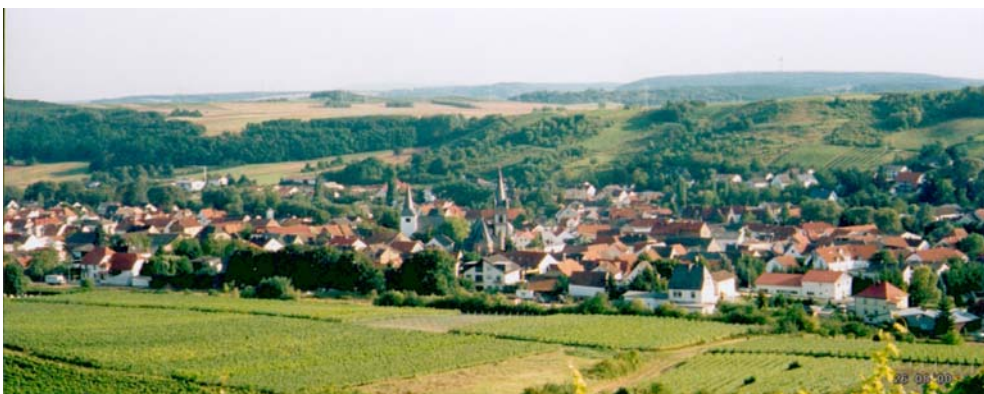
Guldental - Ziel der Asthmagruppe am 11.08.2001